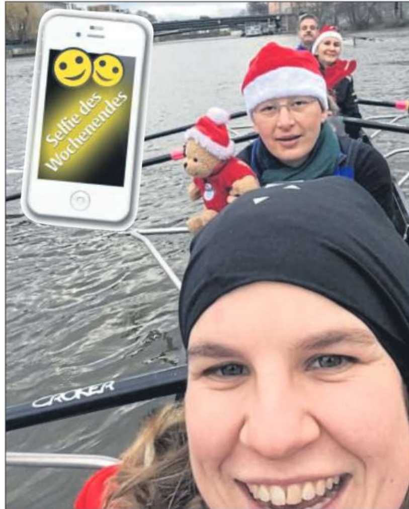
Mit Weihnachtsmütze auf dem Wasser: die Sportler des Rudervereins Cassel 2010 bei ihrer Weihnachtsausfahrt.