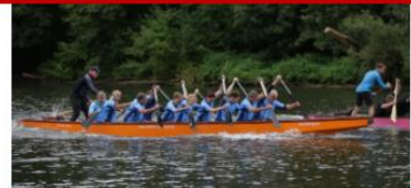
Drachenbootrennen im 10er Boot !