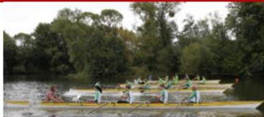
Ruderrennen im 4er !

Meldegeld geht zu 100% an hilfsbedürftige Kinder !