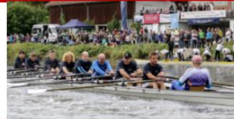
Ruderrennen im 8er !