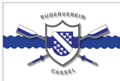
V2: Logo mit Wellenauslauf