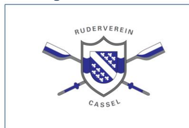
V4: Logo auf weißer Fahne