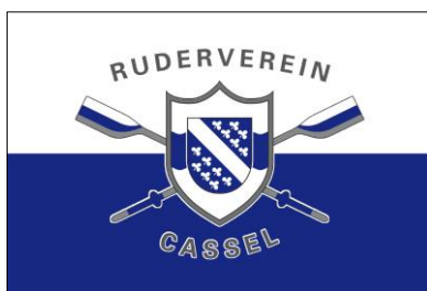
V1: ähnlich Stadtfahne

Ein Logo hat bereits der Verein. 2012 haben wir dieses abgestimmt. Nun benötigt der Verein noch eine Fahne, damit bei Veranstaltungen oder Wanderfahrten auch eine Fahne gehisst werden kann. Zur Auswahl gibt es 4 Möglichkeiten. Bitte stimmt ab, welche Fahne demnächst am Bootshaus wehen soll. http://doodle.com/244ys9p9xv4rsrnh