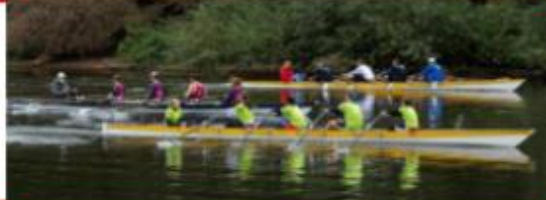
Ruderrennen im Doppelvierer und -achter