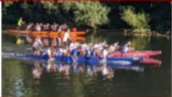
Drachenbootrennen im 10er Boot

15. STAR CARE WIR HELFEN KINDERN Benefiz - Regatta