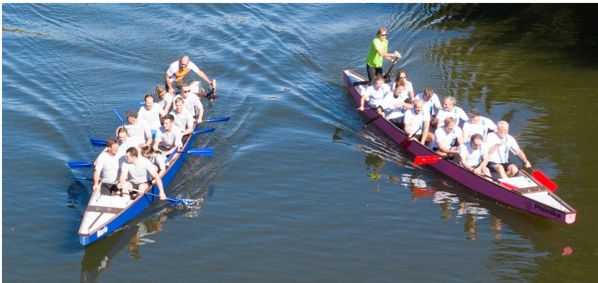
9 Drachenbootteams zeigten spannende Rennen