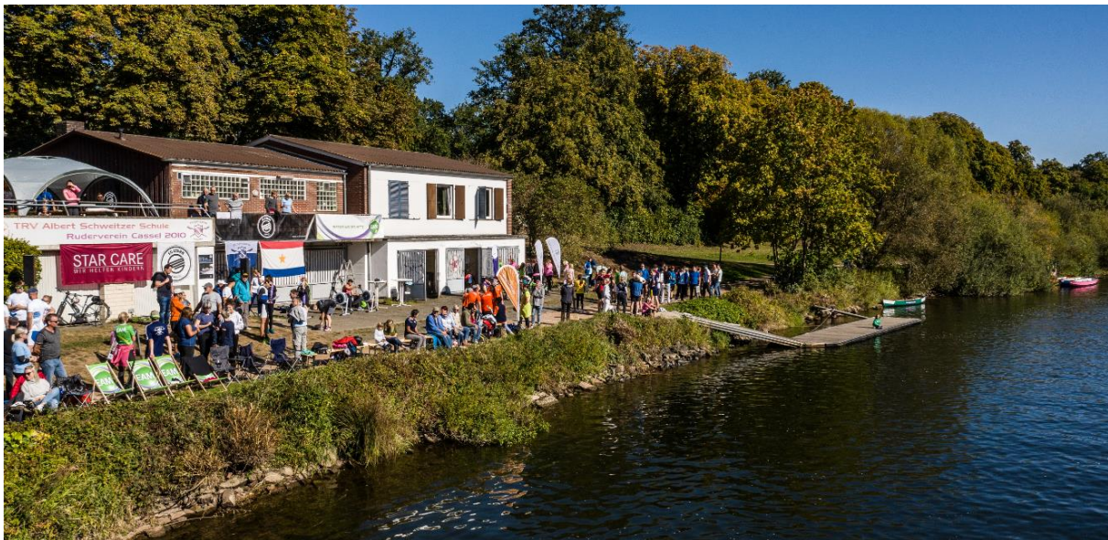
Volles Meldefeld und das Ufer gut besucht mit Zuschauern

Am 21. September war die 13. Auflage der Benefizregatta für hilfsbedürftige Kinder. In 21 Vierern, 20 Achtern und 9 Drachenbooten wurde um die Stadtmeisterschaft der Firmen und Beginners gerudert und gepaddelt. Viele, doch aber weniger als sonst, brachten ein Team mit zur Regatta. Auch ein Team vom RVC war mit am Start und konnte erste Erfahrungen in höherer Schlagzahl sammeln. Wenn man am Ende sagen kann: Wetter top, Wasser top, Kuchen komplett verkauft, Getränke fast alle verkauft und alle haben super an dem Tag mitgezogen – dann war es ein toller Tag ! Vielen Dank an alle Helfer/innen, die sich an diesem Tag und auch im Vorfeld eingebracht haben. Wir können erneut stolz sein, was wir hier geleistet haben.