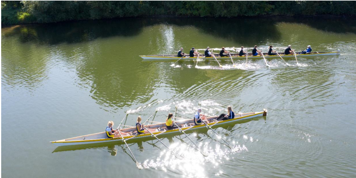
21 Vierer und 20 Achter waren am Start