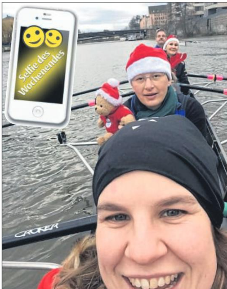
Strahlendes Lächeln: Mit dem Foto von der Weihnachtsausfahrt wurde der Ruderverein Cassel 2010 Selfie des Monats.

Die Aktion Selfie des Wochenendes geht auch im neuen Jahr weiter. Und so funktioniert es: Das Foto soll von einer Person fotografiert worden sein, die auf dem Bild zu sehen ist. Zusammen mit einer Beschreibung und den Kontaktdaten das Ganze per E-Mail an sportredaktion@hna.de senden oder es auf Facebook bei HNA Sport posten. (red)